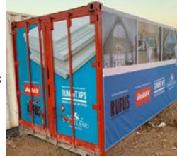
Container @ Six Fountains Development in Pretoria

XPS bedank vir al die harde werk en positiewe benadering. Ons sien meer van ons produk op die paaie oppad na kliënte, te danke aan ons verkoops span. Baie dankie."