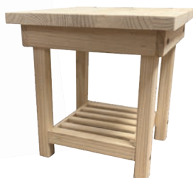
COL Side Table