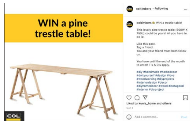
Our COL influencers got behind our latest social media competition.