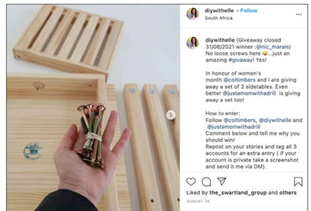
COL celebrated Women's Month by giving away two sets of Side Tables.